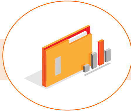
핀업 스택에 제반 서류 전달