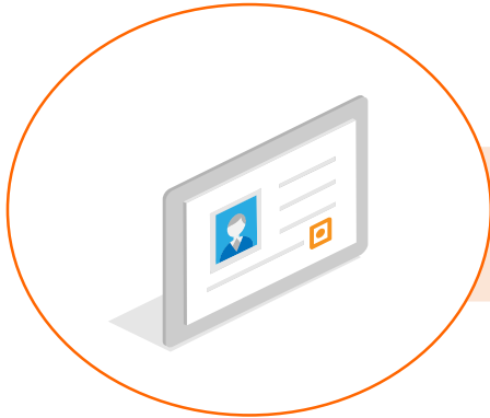
멘토 등록 신청